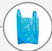
Tous les sacs et films en plastique