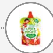
Tous les autres emballages et objets en plastique