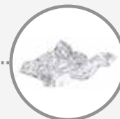
La frigolite, les papiers aluminium et cellophane