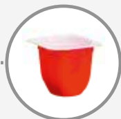
Le pot de yaourt