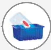
Les barquettes et les ravers en plastique